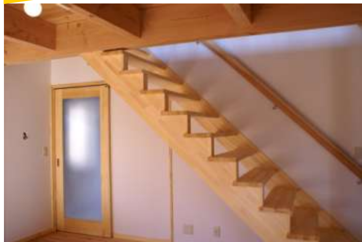
子どもと共に成長する家

来年も沢山の出会いにふれ、皆様の夢をかなえられるように、そして皆様にとりましてもご健康で幸多い素敵な一年になりますようお祈りいたします。